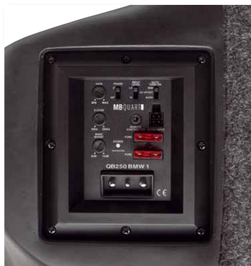
Die kleine, aber hochmoderne Endstufe leistet 150 Watt an 0,5 Ohm auf der Fläche einer Postkarte